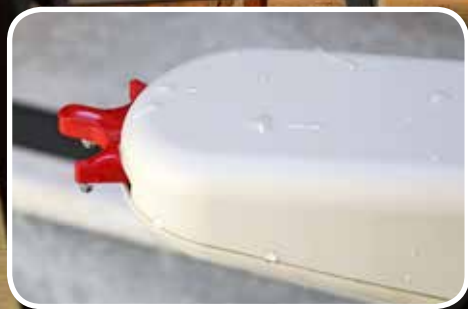
Option - Platinum Horizon pour utilisation extérieure