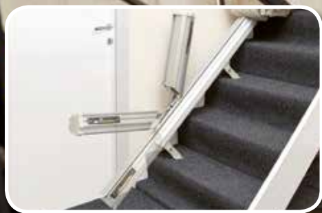
Option - Bras articulé relevable motorisé